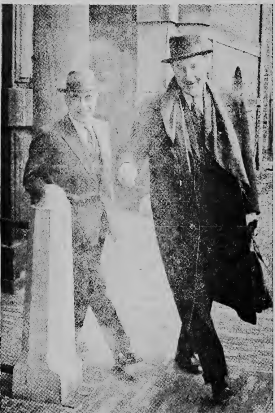
MINISTERRAAD A REUNI. — Ultimamente ministerraad a reuni den Treveszaal pa tuma decisionnan respectu e caso Hulanda—Indonesia. Riba e portret nos ta mira yegada di premier prof. dr. J. E. de Quay i minister di Asuntunan Exterior mr. J. M. A. Luns na Treveszaal.

Na Tahiti a baha ayera di transito pa Biak un avion DC-8 di KLM, cu segun nan ta acepta ta e prome avion di e puente aerea entre Hulanda y Biak. E avion tabatin pasahero a bordo hista na panja civil, pero tur